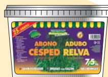
Cubo de 6 kg +25% gratis